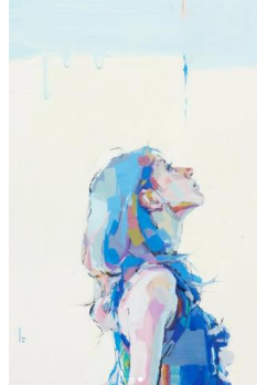
Title : 降りてきてくれた