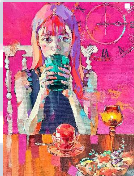
Title : Mocketail party-Alc 0%