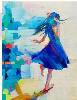
Title : Alice