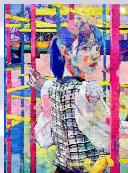
Title : あそぼうよ-少女S