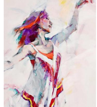
Title : 時を繋ぐII