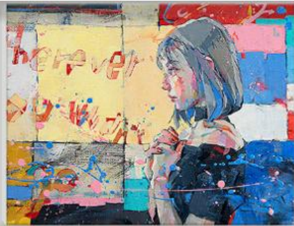
Title : Avatar-夢の正体 I ・ II