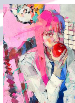
Title : Snow White III