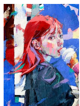
Title : ICECREAM